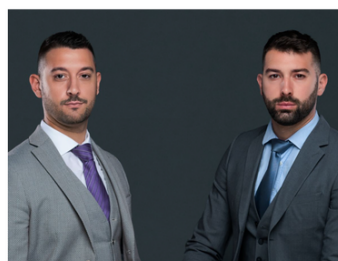
GRUPE FONCIER DE FRANCE

Spécialisé dans la location de logements aux grandes associations reconnues d'utilité publique, le Groupe Foncier de France permet à celles-ci de répondre aux besoins en hébergement des personnes en situation de précarité.