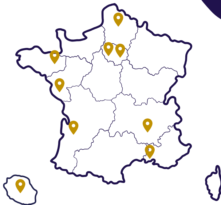
île de la Réunion